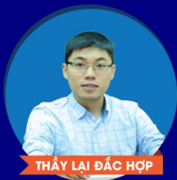
THẦY LẠI ĐẮC HỢP